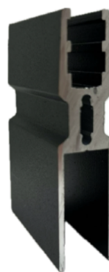
DOLNE MOCOWANIE SZKŁA