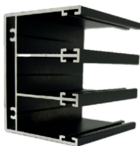
PROFIL GÓRNY PROWADZĄCY